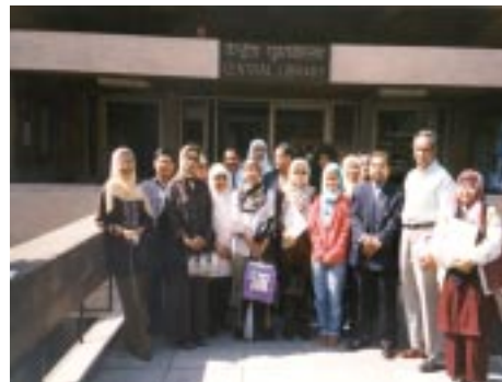
Bergambar di hadapan Perpustakaan Indian Institute of Technology

peluang kepada mereka menyertai program melawat pesta buku yang juga memasukkan lawatan ke perpustakaan sebagai pendedahan kepada mereka. Oleh kerana itu beberapa pembekal telah memohon untuk menjadi ahli PPM. Ramai di antara mereka juga mencadangkan supaya program lawatan ini diteruskan pada masa hadapan kerana mereka ingin turut serta dalam aktiviti tersebut.