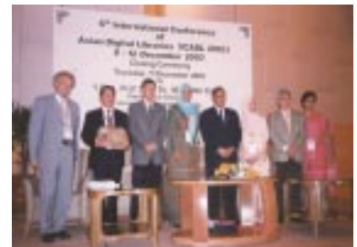
Majlis Penutup ICADL 2003