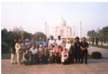
Melawat Taj Mahal, Agra