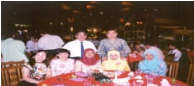
Para peserta ICADL 2003 di Majlis Makan Malam PPM sempena ICADL 2003