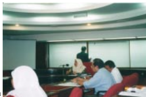
GAMBAR MESYUARAT AGUNG TAHUNAN PPM KUMPULANTIMUR