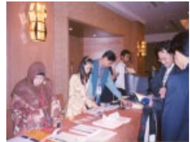
Pendaftaran Peserta ICADL 2003