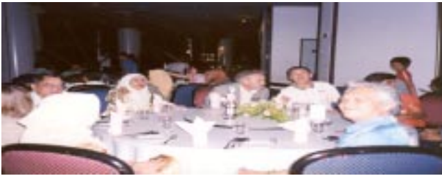
Majlis Makan Malam meraikan Penceramah Dan Pembentang Kertas Kerja ICADL 2003

Pada hari terakhir, penganjur telah mengadakan lawatan ke Putrajaya, Cyberjaya dan Perpustakaan Negara Malaysia untuk para peserta persidangan. Selain itu, sebanyak 16 syarikat pembekal telah mengambil bahagian dalam sesi pameran yang diadakan sepanjang persidangan ini berlangsung. Disamping itu, sesi poster yang disertai oleh beberapa institusi turut diadakan.