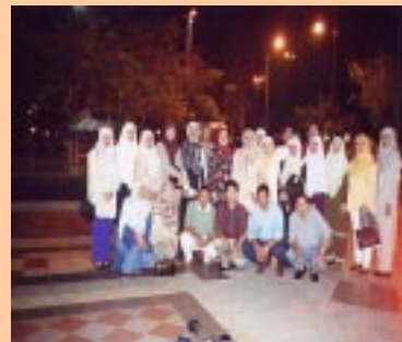
Rombongan PPM bergambar di Jerudong Theme Park, Brunei