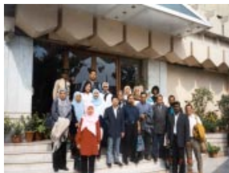
Di hadapan Hotel Hans Plaza, Delhi