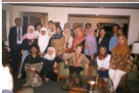
Majlis Makan Malam oleh Narosa Publishing