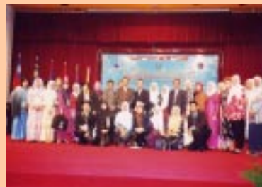
Rombongan CONSAL dari Malaysia

Seramai 28 orang peserta telah mengikuti pakej ini iaitu pustakawan dari pelbagai institusi. Peserta rombongan telah selamat sampai di Lapangan Terbang Antarabangsa Brunei pada jam 2 petang (waktu Brunei) yang disambut oleh pihak agensi pelancongan. Kemudian kami telah dibawa ke sebuah restoran di Centrepoint, Bandar Teluk Gadong bagi menikmati jamuan makan tengah hari.